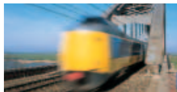
Internationaler Kooperationspartner Nederlandse Spoorwegen Group