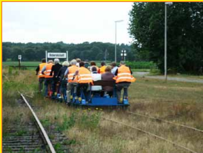
Eine Gruppe Fahrradraisinen verlässt den Bahnhof Ostereistedt

Für weitere Informationen stehen wir Ihnen gerne zur Verfügung. Ihre Draisinenbahn Ostereistedt